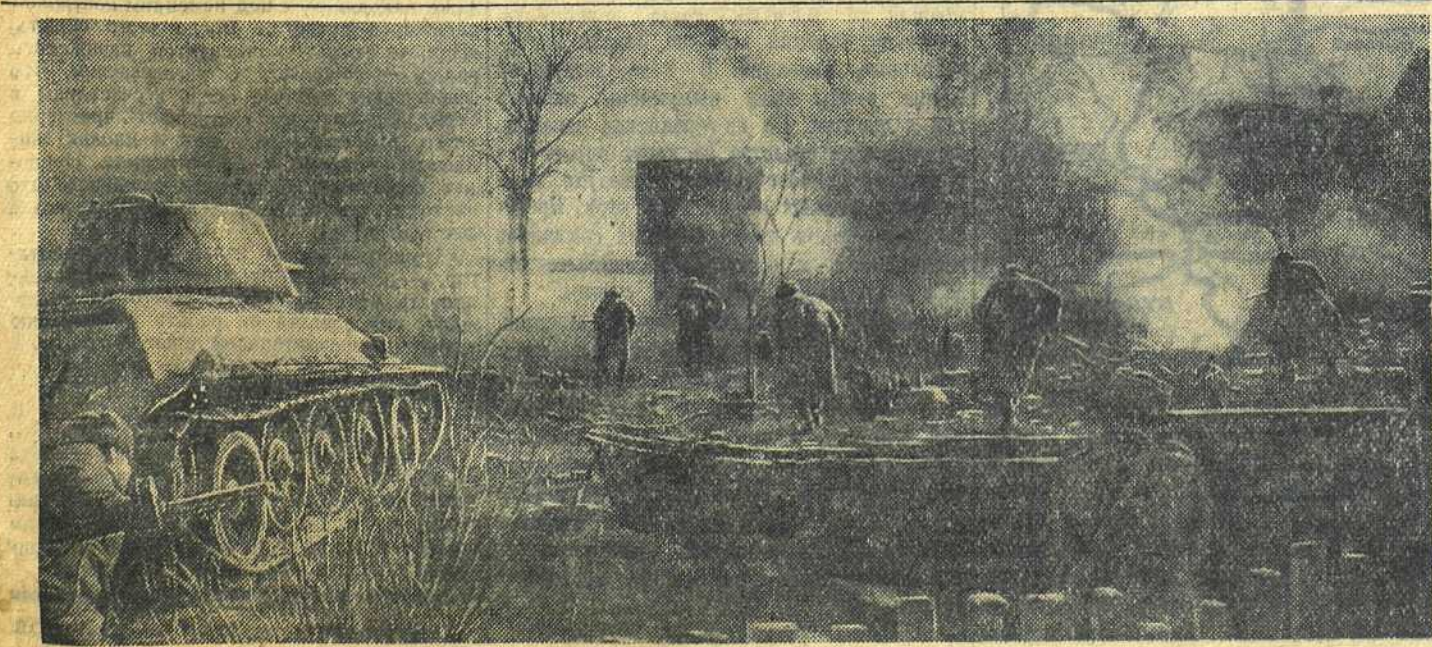
ДЕЙСТВУЮЩАЯ АРМИЯ. Пехота при поддержке танков выводит немцев из населенного пункта.